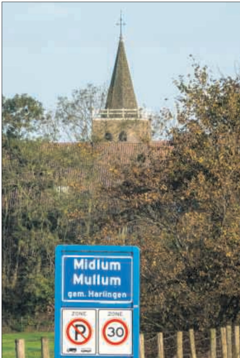
Plaatsnamen eindigend met 'um' verwijzen naar een huis of huizen.

Alles verandert; de mensen, de taal, de gewoonten en zeker ook het landschap. En de mens die er leefde moest zich in alle tijden aanpassen. Woorden verdwijnen en woorden komen. Ook de taal wordt beïnvloed door allerlei factoren. Ook cultureel