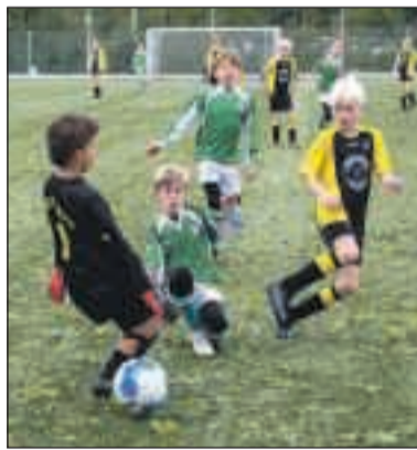
JO12-2 was niet opgewassen tegen AVV en verloor met 0-6.

Morgen in verband met de herfstvakantie maar een zeer beperkt programma. Toch spelen JO17-1 en JO15-1 beiden thuis voor de competitie en wordt er gekeken of er genoeg kinderen weer terug zijn van vakantie zodat de Waddenroebes ook weer verder kunnen met de landencompetitie. Dat alles maakt morgen toch weer tot de mooiste dag van de week.