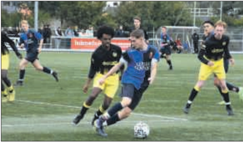
Fc Harlingen JO19-1 had moeite met de verdedigers van Leovardia.