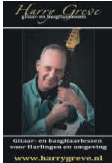
Gitaar- en basgitaarlessen voor Harlingen en omgeving www.harrygreve.nl