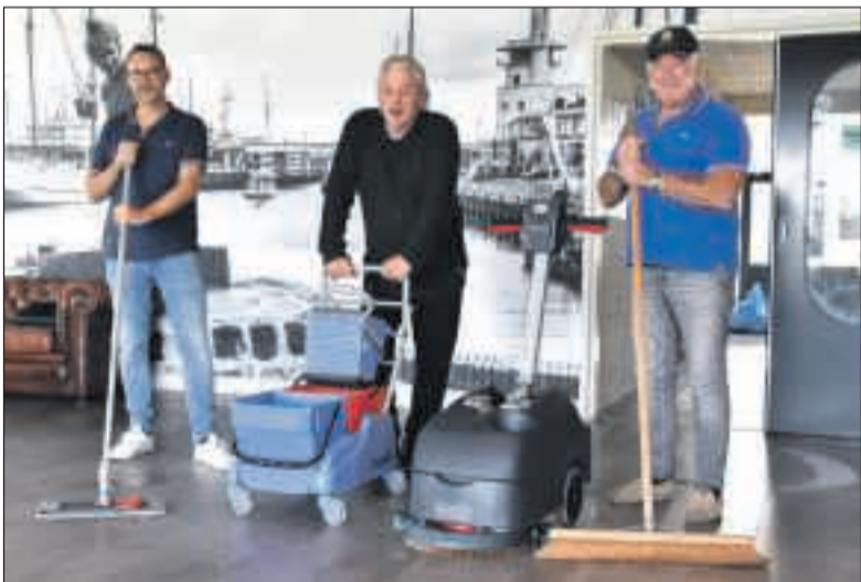
Het Oktoberfeest mag dan voorbij zijn, maar de dankbaarheid voor de schoonmaakploeg blijft bestaan. Dank jullie wel voor jullie inzet.

Fase één met bekerwedstrijden is achter de rug, en nu staat de na jaarscompetitie voor de deur. Hoe gaan de teams zich ontwikkelen? En welke prestaties gaan ze neerzetten naarmate het seizoen vordert? Volgende week meer nieuws rondom de jeugdteams bij fc Harlingen.