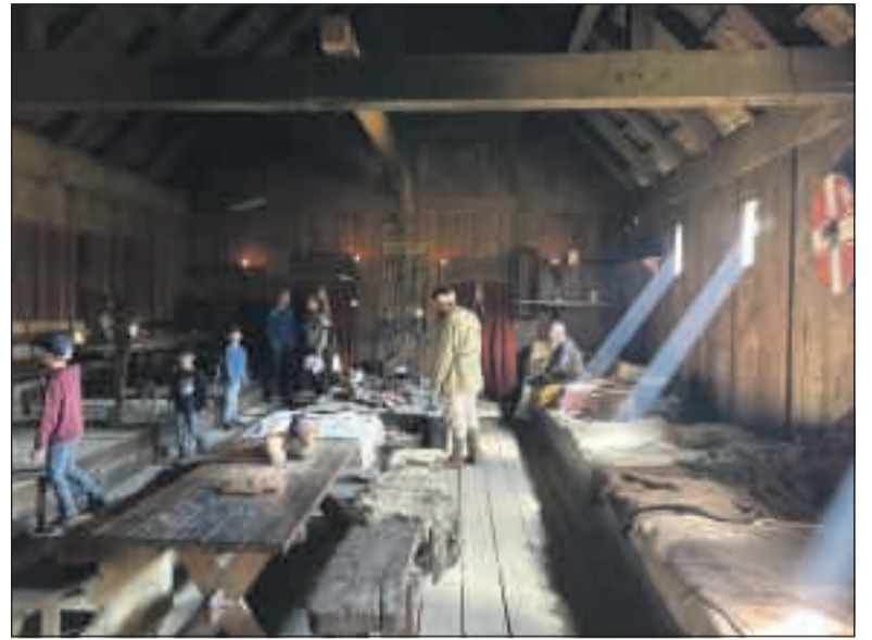
Vlakbij Ribe, de oudste stad van Denemarken, is een openluchtmuseum waar je kunt zien hoe de Vikings leefden.

Zijl zoals in Roptazijl en Kiesterzijl (vroeger ook bekend als: Kiesterzyll, Kiesterdazyl en Kyesterzyll - bron: Wikipedia) verwijzen naar een daar aanwezige sluis. Maar ook Ziel, Siel (het Duitse Greetiel, Neuharlingersiel of Alt-Harlingersiel) of Syl duiden op een aldaar aanwezige sluis. Ga of Gea verwijst naar het landschap, gebied of dorpsgebied, gewest of landstreek. Vik is Wijk. Een