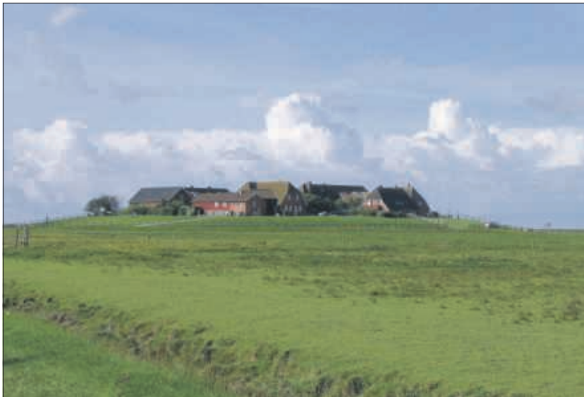
Hooge, één van de Halligen in het noordelijke deel van de Duitse Waddenzee.

Dit artikel werd eerder toegezonden aan onder andere het college van Burgemeester en Wethouders van Harlingen, de raadsleden en aan de Historische vereniging Oud-Harlingen.