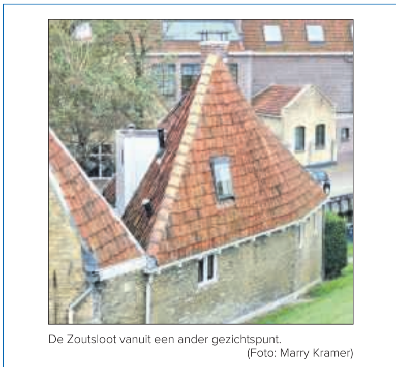
De Zoutsloot vanuit een ander gezichtspunt.

Samen muziek maken, een mooie thema-dans van de Color Guard en het gebruik van vlaggen of rifles, maar ook optochten begeleiden. Dat is Hosanna, en de Harlinger muziekvereniging zoekt muzikanten en Color Guards. Hosanna is een zogenaamde marching band: Hosanna marcheert bijvoorbeeld met de kinderen met lampionnen door de wijken en haalt Sinterklaas en zijn pieten binnen. Hosanna verzorgt ook optredens in andere plaatsen. De muziekvereniging zoekt onder anderen trommelaars of drummers voor grote trom (ook wel overslag genoemd, op z'n Engels de base drum), snaredrum of platte trom, maar ook bijvoorbeeld muzikanten voor xylofoon. Hosanna heeft een goede muzikinstruatie. Aanmelden kan via secretariaat.cmvhosanna@live.nl of bel voor meer informatie: 06-10324873.