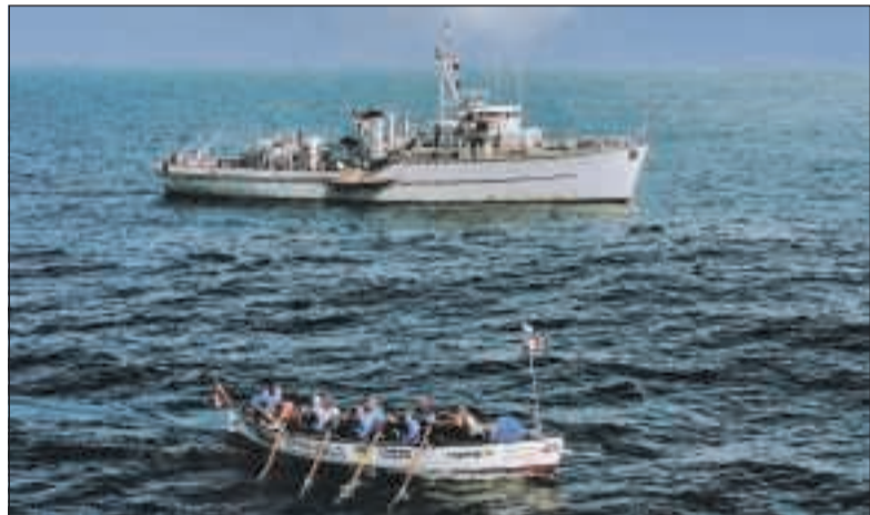
HC-fotograaf Joachim de Ruijter maakte deze foto in 2001 vanuit de SAR-heli toen de Sittard een sloep naar Hull begeleidde.

Voormalig mijnneviger Hr. Ms. Sittard (M830), het schip van de Harlinger zeekadetten, is één van de laatste van zijn soort, de Dokkumerklasse, en heeft een serieuze onderhoudsbeurt nodig. Via het GoFundMe-platform is Cindy Postma een inzamelingsactie gestart om grote delen van de houten romp van het schip te vervangen.