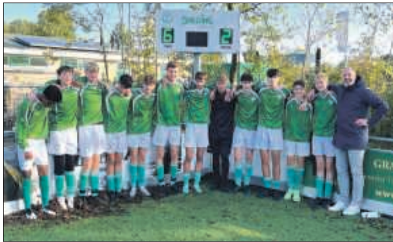
Mooi resultaat van JO17-3 in de laatste wedstrijd tegen Friesland waardoor ze gedeeld eerste werden.