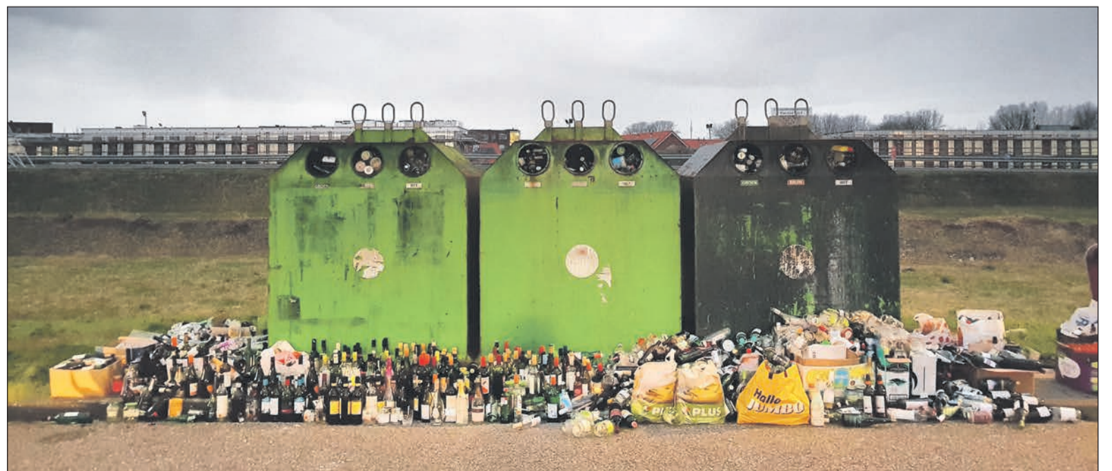
Oliebollen, vuurwerk en een drankje...