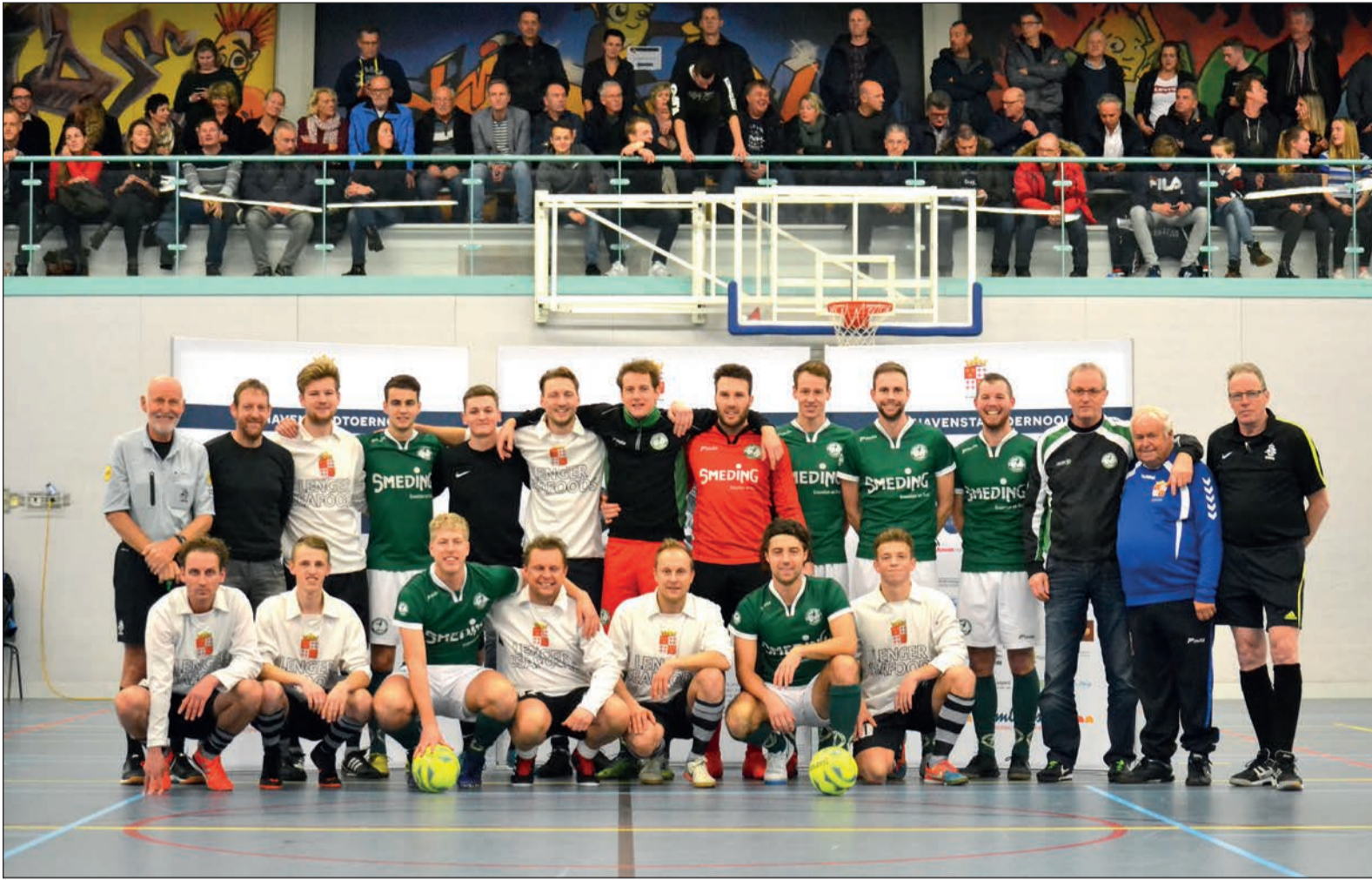
Finalisten Havenstadtoernooi: Regio Team – Zeerobben.