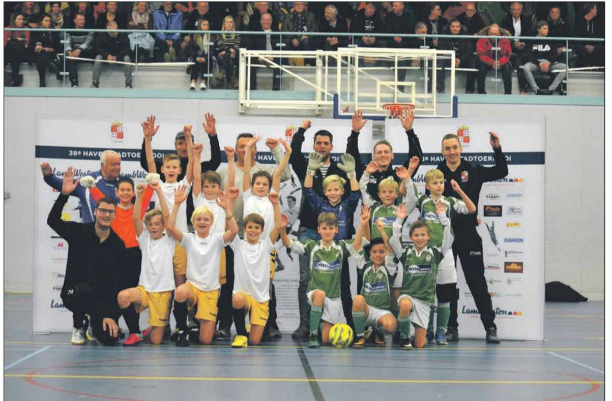
Finalisten Havenstadtoernooi jeugd: sc Bolsward en Zeerobben.