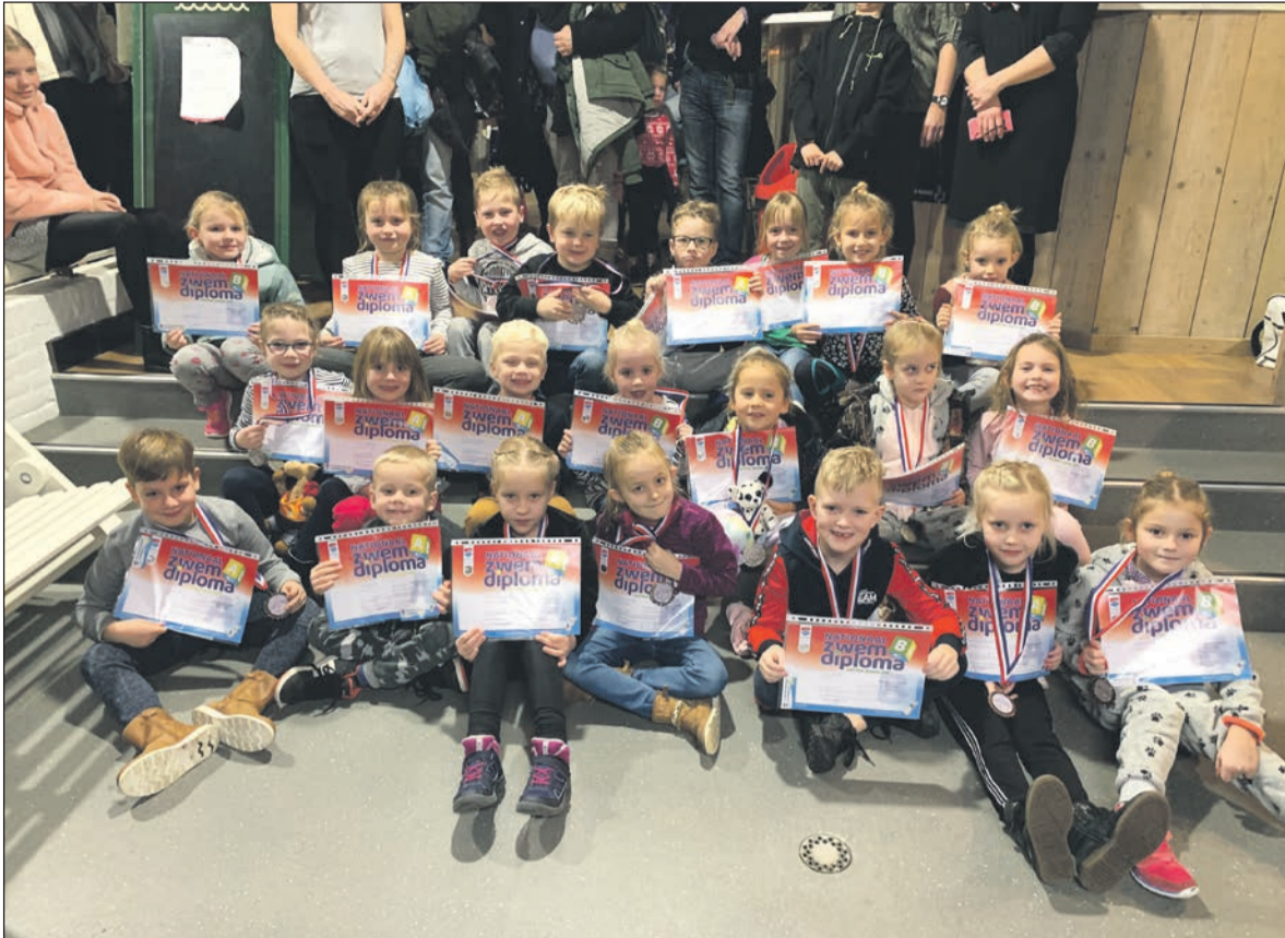
Geslaagd voor A of B diploma.