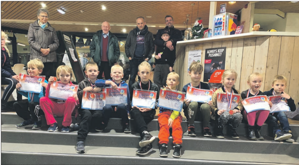
Geslaagd voor het C-diploma.