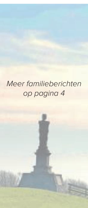
Meer familieberichten op pagina 4