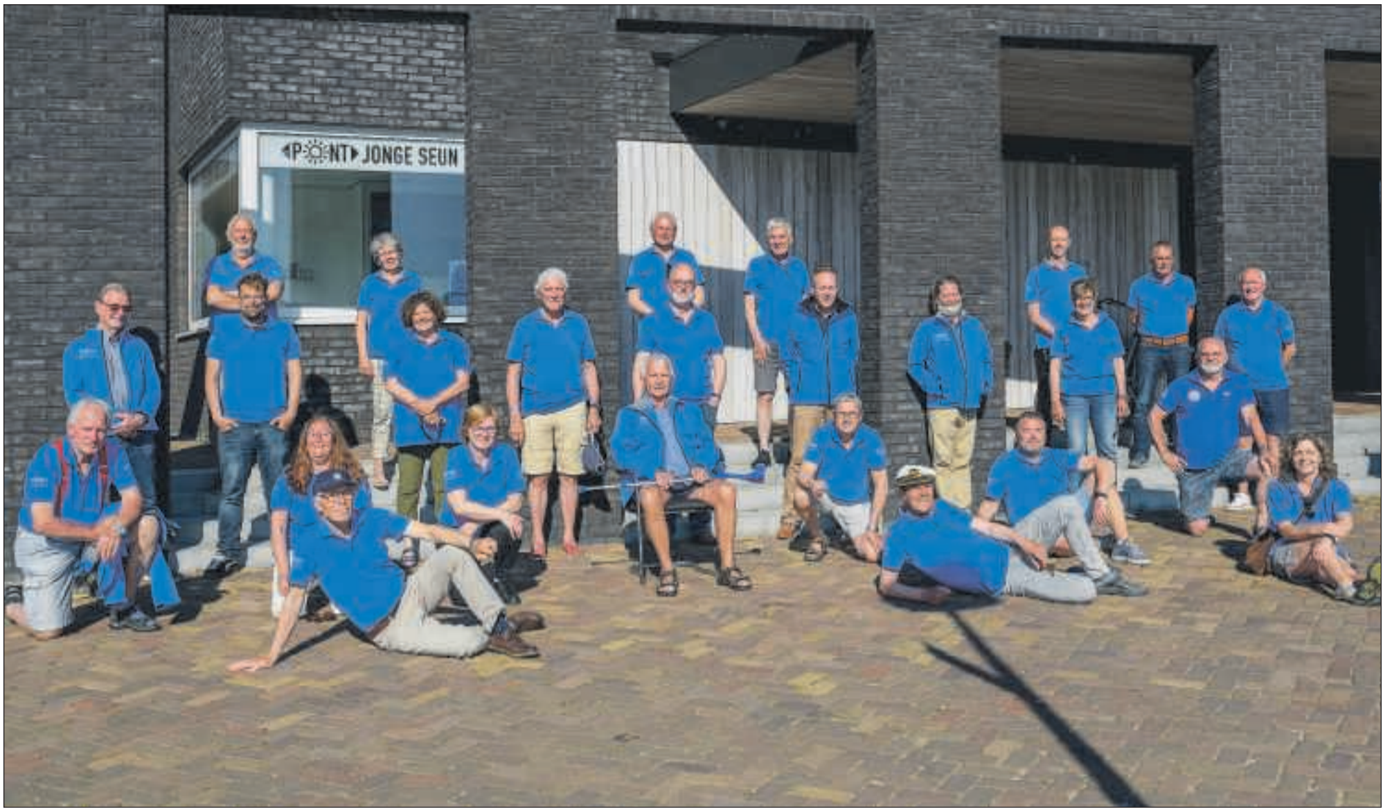
Een deel van de 56 schippers van de Jonge Seun voor hun kantoor in het Badhuus.