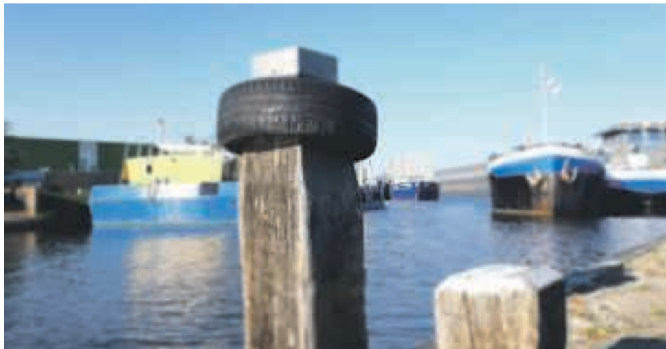
Stilleven aan de Franeker-trekvaart

Evangelie Gemeente Harlingen Zo. 6 juni 10.00 dienst