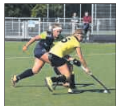
Binnenkort weer een gewoon beeld aan de Westerzeedijk: teams van Friese clubs die tegen elkaar een wedstrijd spelen.