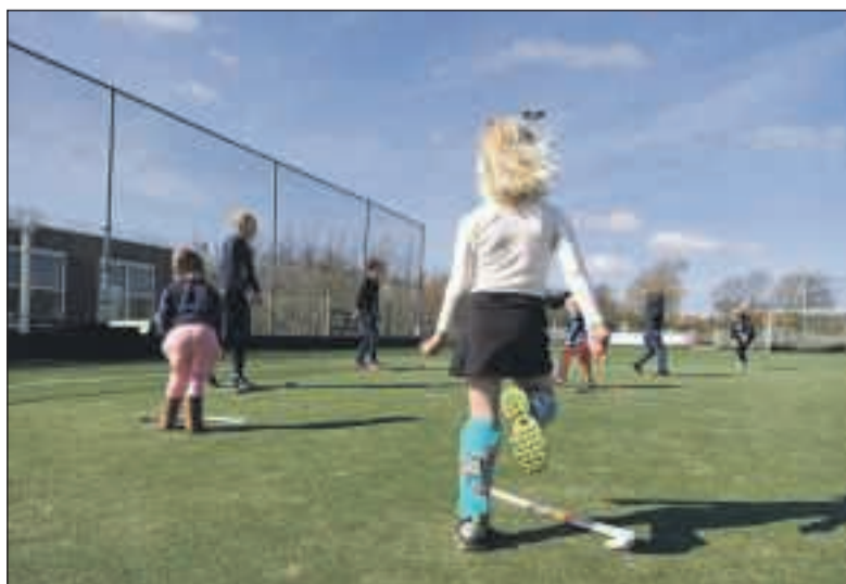
Ook bij de Funkeys is veel animo om te gaan hockeyen.

Het is traditie dat HMHC het seizoen afsluit met een familiedag. Hockey is een echte familiesport, voor (groot)vaders en (groot)moeders, voor broertjes en zusjes. Op de HMHC familiedag hockeyen deze allemaal samen, met veel gezelligheid op en rond het veld, ook na de onderlinge wedstrijden. Het is nog even afwachten of het allemaal mag en kan, maar binnen HMHC wordt voorzichtig nagedacht om toch dit jaar nog een Familiedag te organiseren. Houdt dus zondag 4 juli, de laatste zondag voor de zomervakantie, vrij. Binnenkort wordt hierover meer bekend.