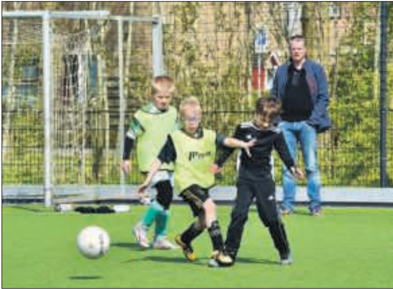
Voor de JO8/JO9 en voor de JO10/JO11 groep ook afgelopen zaterdag weer een onderling toernooi.