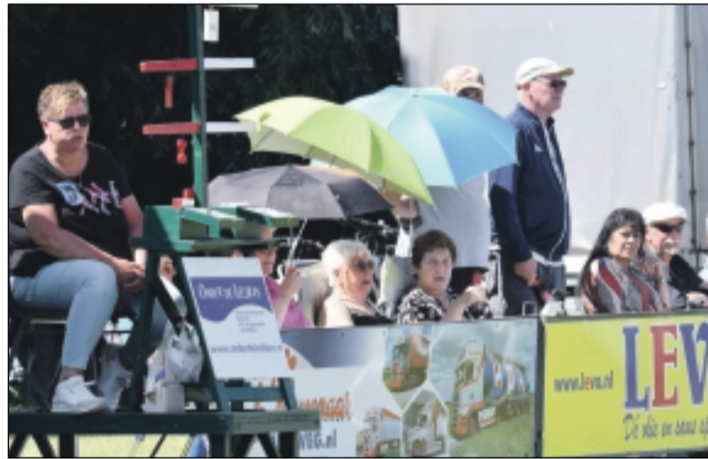
Het was goed toeven op het veld van KV Eendracht.