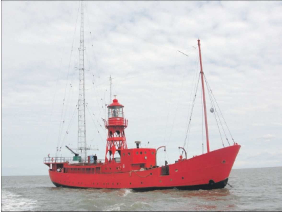
Radiolichtschip Jenni Baynton.

Zaterdag 31 augustus 2024 is het precies 50 jaar geleden dat de zeezenders die vanaf schepen voor de Nederlandse kust uitzonden, hun uitzendingen moesten staken. De stop kwam door een wetswijziging, die de medewerking aan en adverteren op radiozenders Veronica, Noordzee, Atlantis, Mi Amigo en Caroline illegaal maakte. Dat is reden voor het enige zendschip dat Nederland nog heeft, de Jenni Baynton in Harlingen, om in de laatste week van augustus nog eenmaal het geluid van de zomer van 1974 terug te brengen.