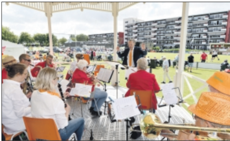
't Stedelijke zorgde voor de muziek.