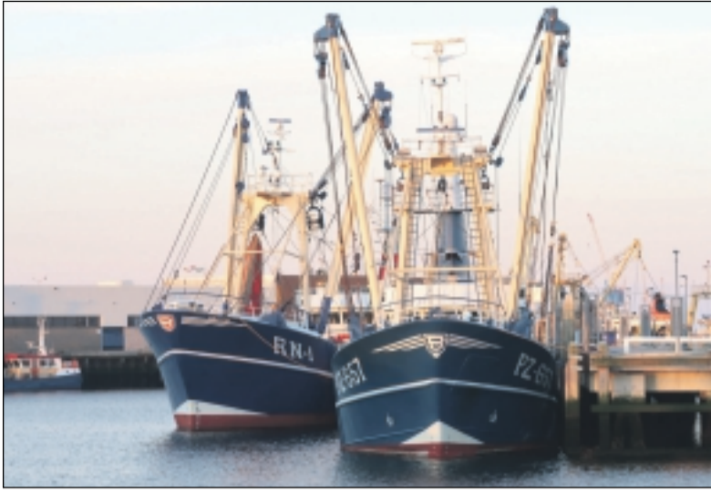
De Brits gevlagde boomkorkotters RN-1 en PZ-657 zijn eigendom van Urker ondernemers.